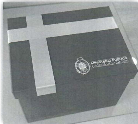
Imagen presentación referencial

Diseño: La gráfica del Evento será proporcionada por el área usuaria en coordinación con la Oficina de Imagen Institucional de la Agencia Espacial del Perú – CONIDA.